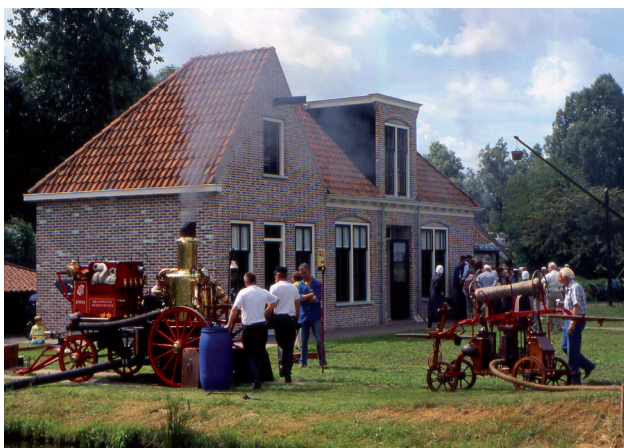
Spuitgasten aan het werk tijdens een "Folkloredei"