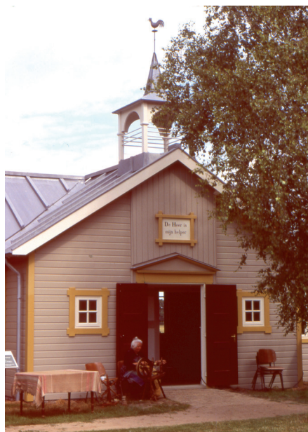
it Houten Himelstje

Freonen fan it Damshûs FREON(-DIN) zijn heeft ook VOORDELEN